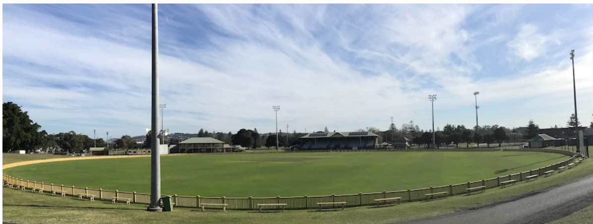
Sportsground No 1, Newcastle, NSW, Australia

Vrlo brzo nakon što me život doveo Down Under sam otišao pogledati vaterpolo utakmicu prve nacionalne lige. Isto tako nogometnu. Ali ovo nije priča ni o vaterpolu ni o nogometu, nego o jednom, kao što sam u početku mislio, jako čudnom sportu. Nije mi bilo jasno kako je moguće da sport gdje jedna te ista utakmica koja se igra 7-8 sati dnevno, 5 dana zaredom i nerijetko završi neriješeno može uopće biti ikome zanimljiv.